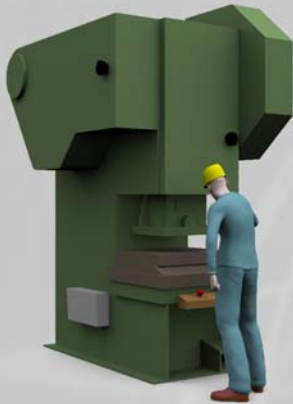
CSA Z142-02 Sécurité des presses