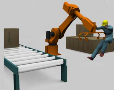
CSA Z434-03 Sécurité des robots industriels